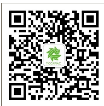
扫码添加茶委会官方微信 了解行业前沿信息