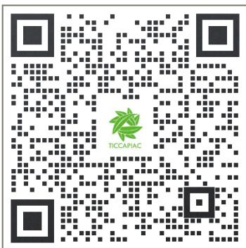
扫码添加工作人员微信 了解展会详细情况