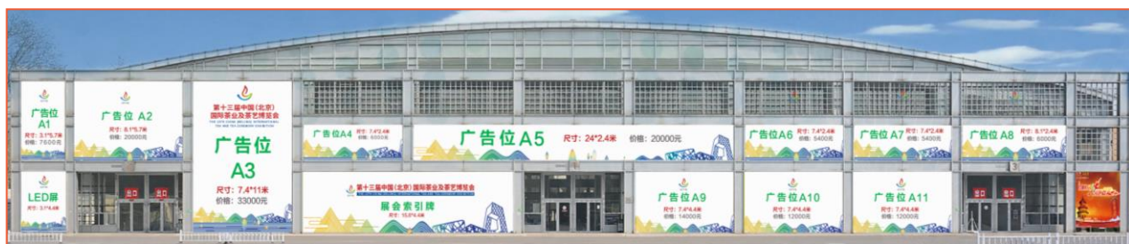
11 号馆展馆入口·巨型广告