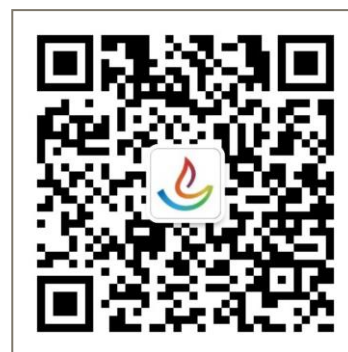
扫码添加茶博会官方微信 了解展会最新咨询